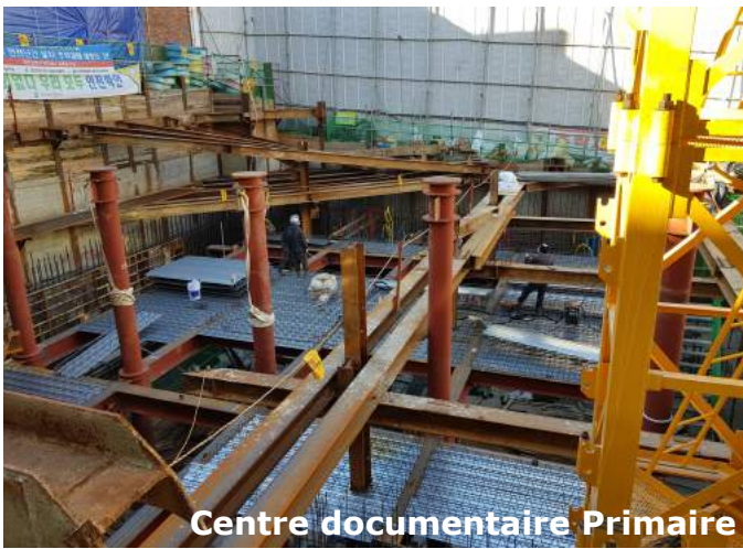
Centre documentaire Primaire