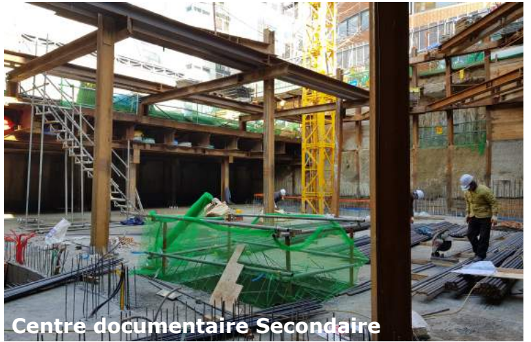
Centre documentaire Secondaire